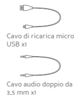
Cavo di ricarica micro USB x1