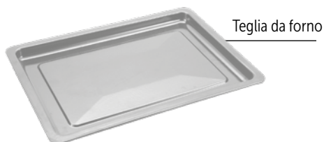
Teglia da forno