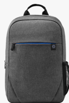
Zaino HP Prelude da 15,6" 2Z8P3AA