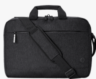
Borsa HP Prelude Pro 17,3" Laptop Bag 3E2P1AA