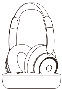
HEADSET BLUETOOTH CON BASE RICARICA