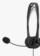
Cuffie stereo HP da 3,5 mm G2 428H6AA