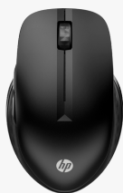
Mouse wireless multi-dispositivo HP 430 3B4Q2AA