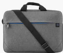
Borsa per notebook HP Prelude da 15,6" 2Z8P4AA