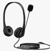
Cuffie stereo USB HP G2 428H5AA