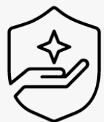
Ritiro e restituzione per 3 anni U1PS3E