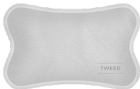
BORSA ACQUA CALDA ELETTRICA