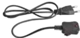
CAVO DI RICARICA